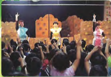
2015年 奄美大島公演 福祉基金設立40周年の2015年には、 5つの離島で公演を行いました。

“つばさ”は子どもたちの歓声とエネルギーをひき出し、一体感あふれる舞台を創造します。 子どもを静かにさせて、一方的にお話をするのではなく、 子どもに問かけ対話する中で子どもたち自身がおはなしの主人公になって 物語をつくり出してゆきます。