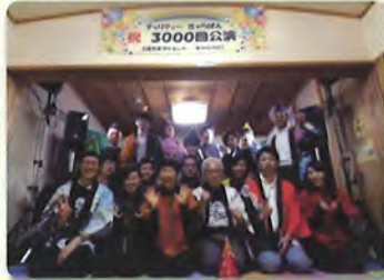
2016年『きゃらばん』3000回 島根公演実行委員集合風景 『きゃらばん』は、日産労連で働く仲間 が公演調整や舞台設営の準備をして います。